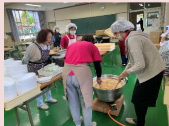
四番丁ふれあい祭り 防災訓練の炊き出しカレー作り お手伝い