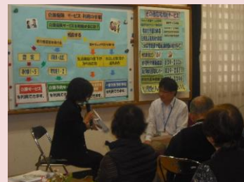
出前講座 介護保険制度と 申請について

『いい地域には住民がふれあう場がある』支援センターさぬきは地域の一員として行事に参加し、地域の皆さまとの繋がりを大切にしていきたいと思っております。