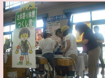
亀阜民協フェスタ 小学生対象お年寄り疑似体験