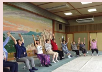
高齢者介護教室 笑いヨガ 笑う門には福と健康が来る！ 介護予防体操